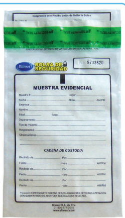
Bolsa de Custodia

DrugCheck® es ideal para propósitos de pre-empleo, post-accidente, pruebas al azar, aptitud para laborar y motivo de sospecha.